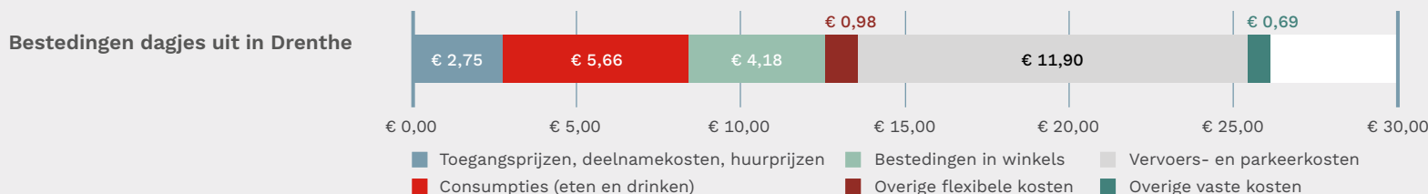
GRAFIEK 3: Gemiddelde besteding dagje uit in Drenthe.

Het Continu VrijeTijdsOnderzoek (CVTO) wordt eens per 3 jaar uitgevoerd; de laatste editie bevat data over 2018. Totaal ondernemen Nederlanders 53,8 miljoen uitstapjes in Drenthe, met een gemiddelde besteding van €26,16. 63% van de uitstapjes in Drenthe worden door eigen inwoners gemaakt, ruim een derde door bewoners van andere provincies (19,7 miljoen uitstapjes).